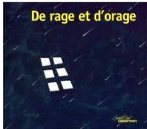
De rage et d'orage, Anne-Sophie de Montsabert, ill Stéphane Girel, Castermann 2000