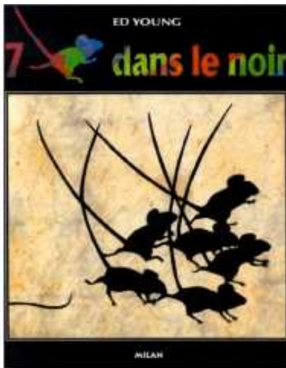
7 souris dans le noir, Ed Young, Milan